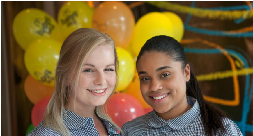
Medewerkers van McDonald's delen op de wervingssite hun eigen ervaringen

Amsterdam, 3 augustus 2017 – Mobile first, video's van eigen medewerkers, solliciteren vanaf de mobiele telefoon en een unieke chatbot-functie, waarmee vragen aan sollicitanten worden gesteld in plaats van de vragen op een sollicitatieformulier. De nieuwe wervingssite ( www.werkenbijmcdonalds.nl ) van McDonald's Nederland speelt volledig in op de mobile first generatie, waarbij gemak en toegankelijkheid centraal staan. Solliciteren bij de Mac was nog nooit zo eenvoudig! McDonald's Nederland lanceert de nieuwe wervingssite omdat het nu en de komende jaren volop op zoek is naar gemotiveerde en getalenteerde medewerkers voor haar 244 restaurants in Nederland.